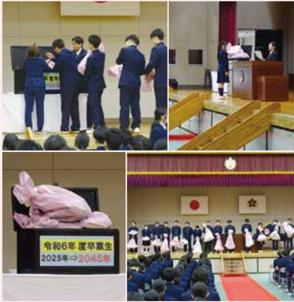
「同窓会入会式」タイムカプセル封印セレモニーより