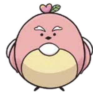
成蹊 公式キャラクター ももまる SINCE 2024

これは私にとって思いがけない貴重な経験でした。お店の運営を通じて感じていた人とのつながりを、今回あらためて母校との関わりの中にも実感しました。このご縁を今後も大切にしたいと思います。