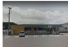
セブンイレブン・約13分

A区画： 済 B区画：6,397,600円 C区画：6,428,800円 D区画：5,997,750円