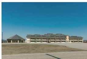
町立甘楽中学校・約26分