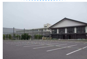
町立福島小学校・約13分