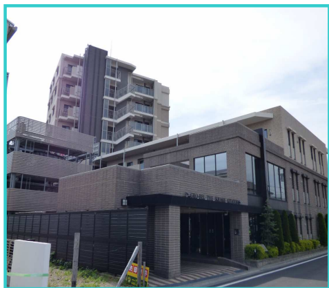
《現地外観・エントランス側》

JR埼京線「北戸田」駅・徒歩9分 ◆平成22年築・専用庭付の 解放感のあるお部屋です！