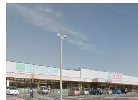
ダイソー・エコス