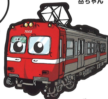
岳南電車オリジナルキャラクター 岳ちゃん