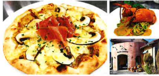
生ハムとジャンボマッシュルームのピザ 1,330円(税込)

生ハムとチーズに負けない、マッシュルームの濃厚な香りと 旨味。石窯で焼き上げる、洗練されたミラノピッツア。フリッ ターも人気です！正統的イタリア料理を学んだ総料理長が、 自慢の腕を振るう渾身の北イタリア料理をお楽しみください。