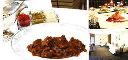
伝統のハヤシライス 1,400円(税込)

創業から50年以上受け継いだハヤシライス。10日以上煮込 んだデミグラスソースには、長谷川農産のマッシュルームの旨 味が溶け込み、濃厚なコクと香りが醸し出された一品です。上 質なサービスと優雅な空間で、こだわりの味をご堪能ください。