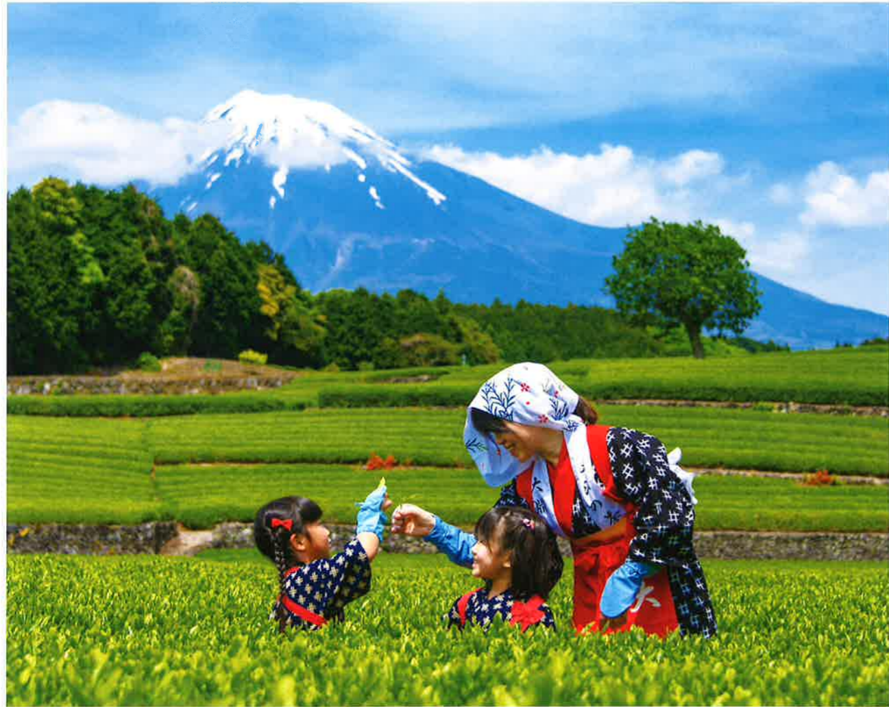
静岡県 富士市主催 富士山百景 写真コンテスト 入賞作品「一親二幼」