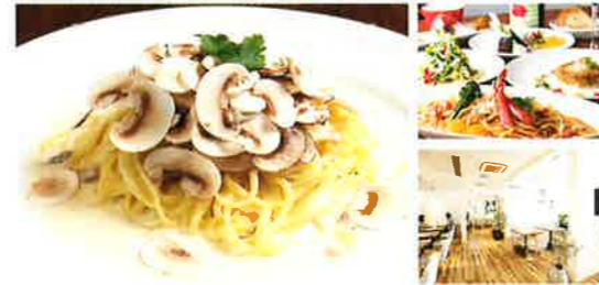
長谷川農産のフレッシュマッシュルームとパンチェッタのクリ ムパスタセット(サラダ+スープ付) 1,580円(税込)

新鮮な長谷川農産のマッシュルームだからできる、薄切り スライス。香りと食感をお楽しみください。「ココロとカラダ が喜ぶ」新鮮野菜とBEPINごはんをご用意してお待ちし ています。