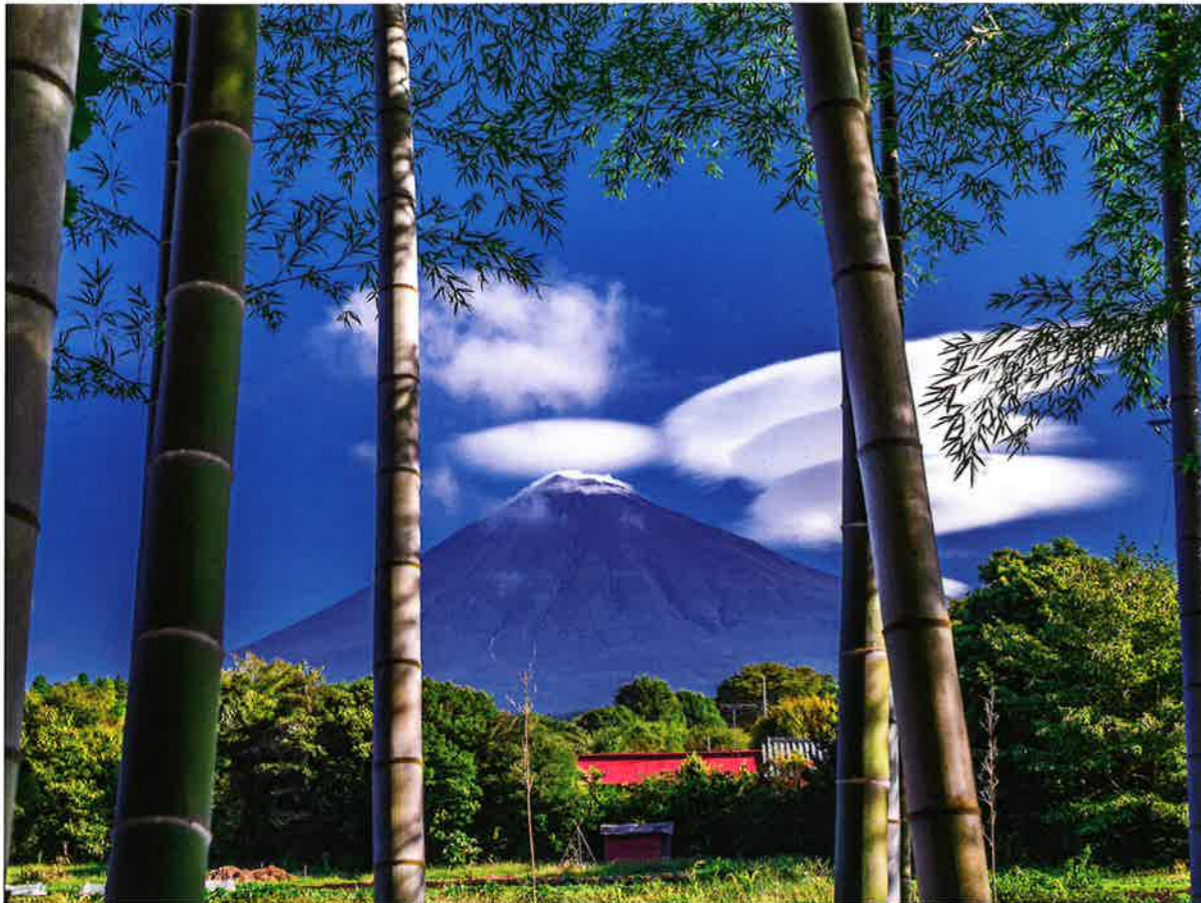
静岡県富士市主催 富士山百景写真コンテスト 入賞作品「竹撮(取)物語」