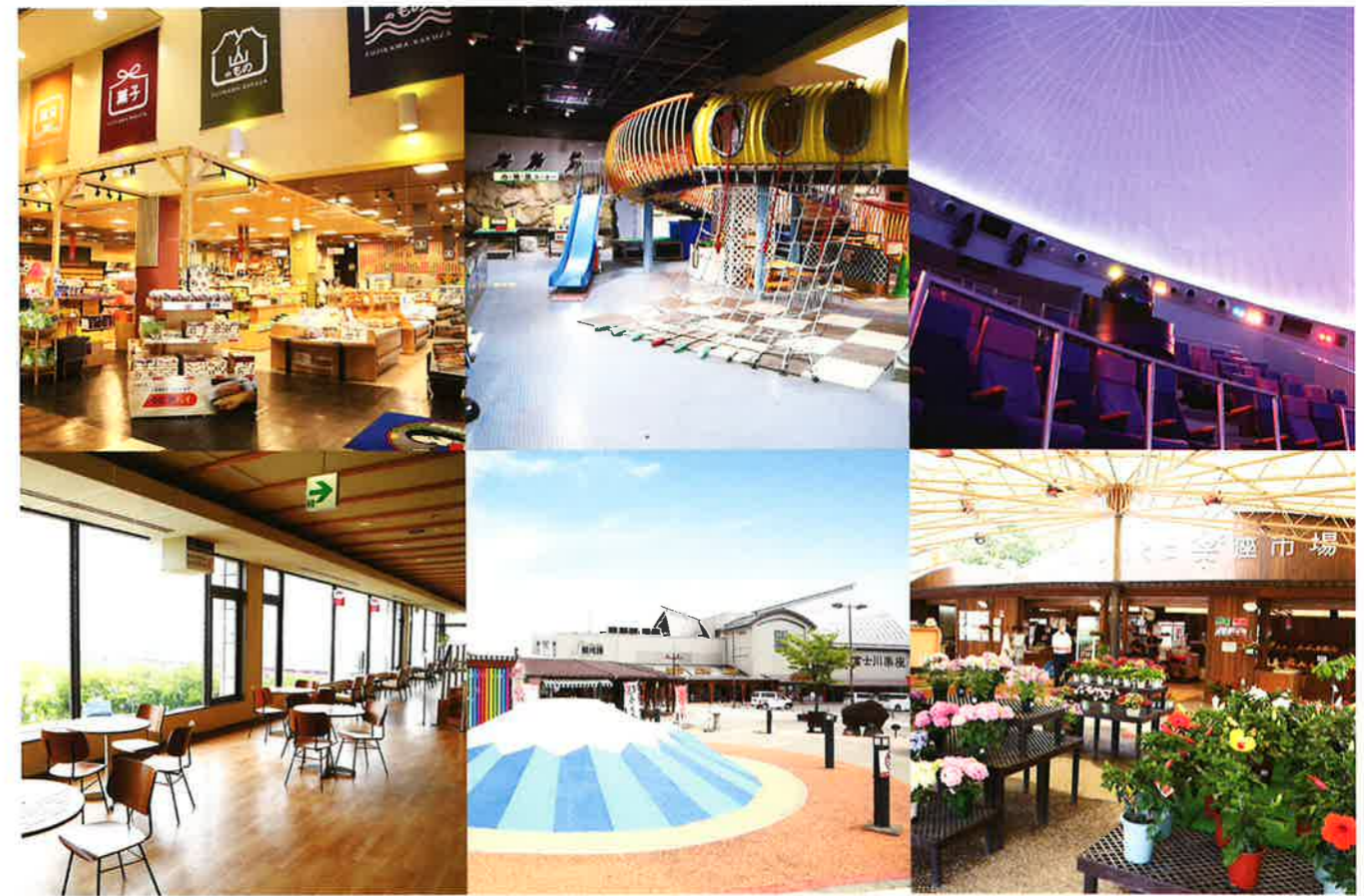
左上：お土産売り場 / 中央上：体験館どんぶら / 右上：プラネタリウムわいわい劇場 / 左下：展望ラウンジ / 中央下：3階広場 / 右下：ふじのくに楽座市場