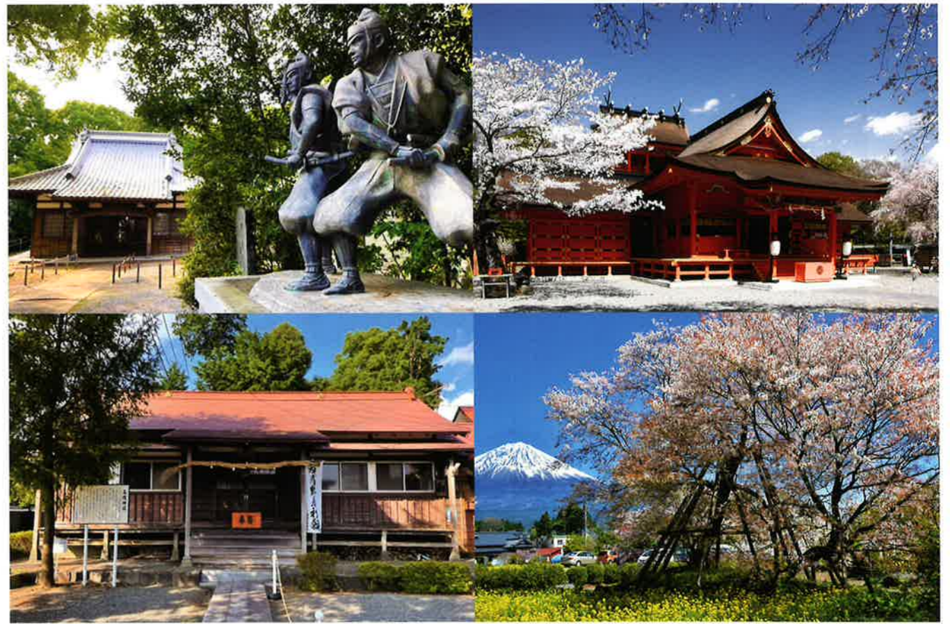
右上 / 富士山本宮浅間大社 右下 / 狩宿の下馬桜 左上 / 曾我寺 左下 / 玉渡神社

【狩宿の下馬桜】 日本五大桜のうちのひとつです。富士の巻狩の際に、源頼朝がこの桜に馬を繋いだといわれています。そのため、「駒止めの桜」とも呼ばれています。 【曾我寺】 富士の巻狩の際に父の仇討ちを果たした曾我兄弟の墓と像があります。正式名称は「鷹岳山福泉寺」ですが、地元の人からは「曾我寺」と呼ばれ親しまれています。 【玉渡神社】 兄・曾我十郎の愛人である虎御前が曾我兄弟の霊を慰める旅に出ると、火の玉が二つ現れました。兄弟の魂に違いないと思った虎御前は、念仏を唱えて冥福を祈りました。その姿を健気に感じた村人たちが、ここに虎御前を祀りました。 歴史上の人物や出来事に深く関わりのある富士地域のスポットを、是非散策してみてください。 【富士山本宮浅間大社】 源頼朝や北条義時など、多くの人物が厚い崇敬を寄せました。 源頼朝は、富士の巻狩の際に流鏝馬を奉納したと伝えられており、これが流鏝馬祭りの起源ともいわれています。 大河ドラマ「鎌倉殿の13人」の放送を機に、ドラマの登場人物ゆかりの地の注目度も高まっています。 今回は、富士地域の歴史的なスポットを4つご紹介します。