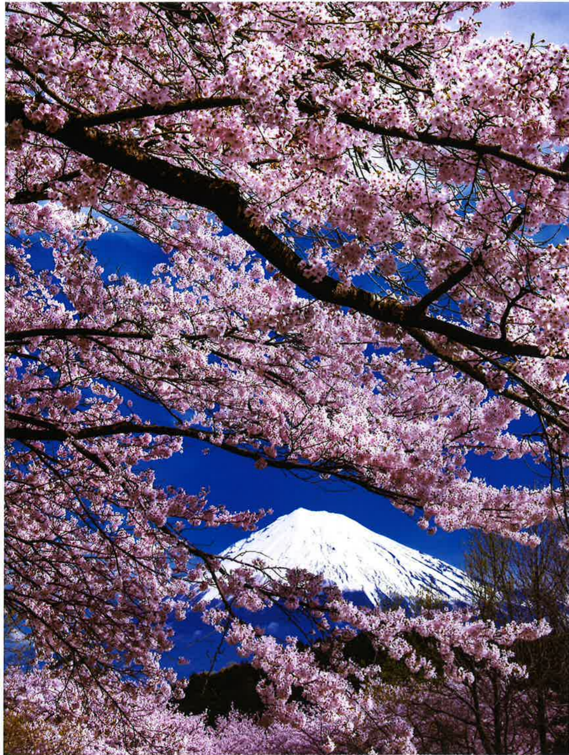
静岡県 富士市主催 富士山百景写真コンテスト エリア賞 「春爛漫」