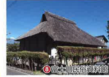
富士川民俗資料館