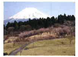
① 富士山こどもの国