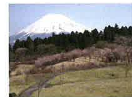
①富士山こどもの国