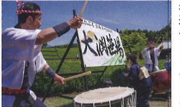
2023 大淵笹場フォトコンテスト 応募作品 kazuonumata さま