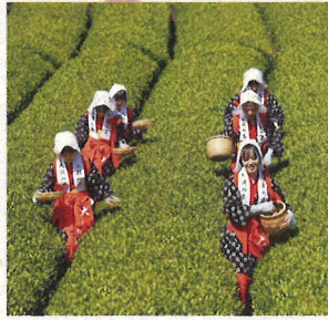
2023 フォトコンテスト 応募作品 huge1091 さま

茶摘みをする茶娘の風景を写真におさめませんか？ 撮影会は開会式終了後から行い、途中休憩をはさみながら行きます。 茶娘モデルは地元の小中学生・高校生がメインです。 マナーを守りトラブルのないように撮影をお願いいたします。