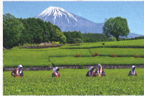
2023 フォトコンテスト 入賞作品 akemi.186 さま