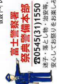
富士警察署 祭典警備本部

☎0545(31)1550 迷子・落とし物・治安等。 安心してお祭りをお楽しみ下さい。