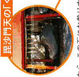
毘沙門天の「くつつ石」

龍は願望のメッセンジャー。 この香炉にお線香をたてると、その 煙りは龍となり願いを神に届けます。