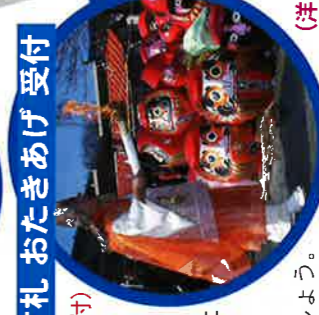
古ダルマ・古札 おたきあげ 受付 (大祭期間中のみ受付)

一年の厄災を 背負って下さった ダルマさんを、 御供養して おたきあげしましょう。