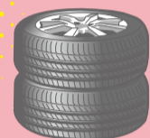
車のタイヤ (丈夫なゴムをつくる)