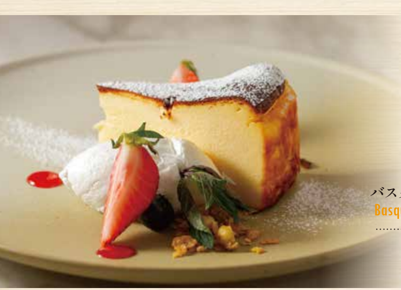
バスクチーズケーキ Basque cheesecake .....¥600