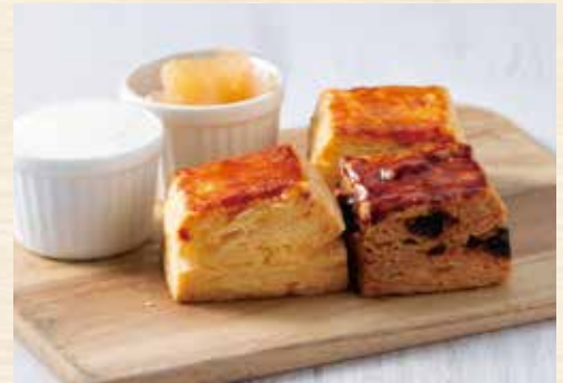
3種のスコーン ★プレーン★レーズン★チョコレート Scones.....¥780 ※スコーンは焼き立てをご用意しますので提供までに 10分ほどお時間をいただきます。 アレルギー:小麦・卵・乳