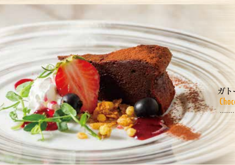
ガトーショコラ Chocolate cake .....¥600

ドリンクセット 【コーヒー or 紅茶 or ハーブティー】 .....+ ¥300 ※スイーツメニューご注文の方に限ります