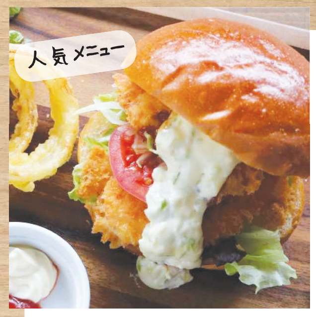
ヴィレッジ特製 釜火尭きバーガー <武、尊サーモンカツ>(スープデザート/すき)

甘く香り、とろけみ皆身に凝縮した旨味としっとりした赤みの バランスが最高な上り川牛をすき火尭きでご用意しました。 いつものランチをちょっと贅沢にお楽しみください。