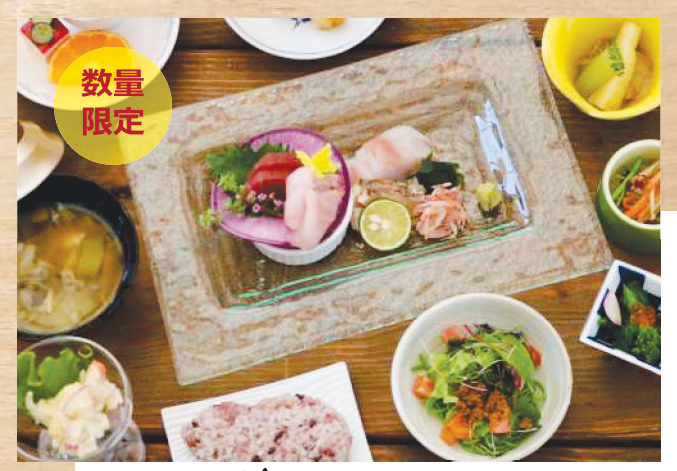
東山身月蓋 (小鉢球重・五穀米御食の本中管・ナ・デザートイすき) 1,870円(税込)