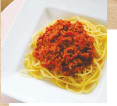
お 子様ミートパスタ (デザート付き) 880円(税込)