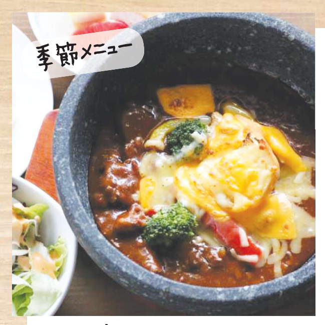
上 小川牛 の石 火尭きビーフシチュー パングラタン(サラダ・ライス・デザートイすき)