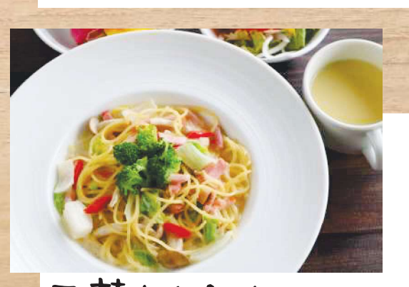
日替わりパスタ (サラダ・スープ・デザートイすき) 1,210円(税父)