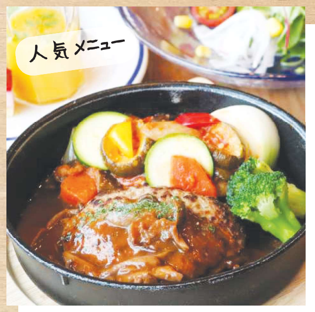
上 小川牛 と上 小川柔のハンバーグ (サラダ・スープ・ライス・デザートイすき)

じっくり煮込んだビーフシチューとまろやかなチーズは木剛生 抜群、パンと一緒にグラタン仕立てでご用意しました。 最後まで熱々で食べられる石焼き鍋が嬉しい♪