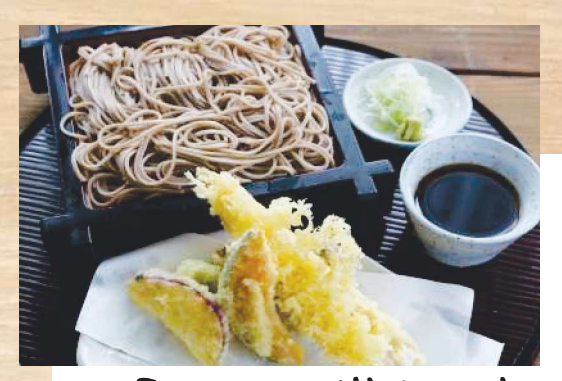
川場村の大岩魚と春野菜の 天 婦 紅蕎麦(デザー)(対き) 1,430円(税込)