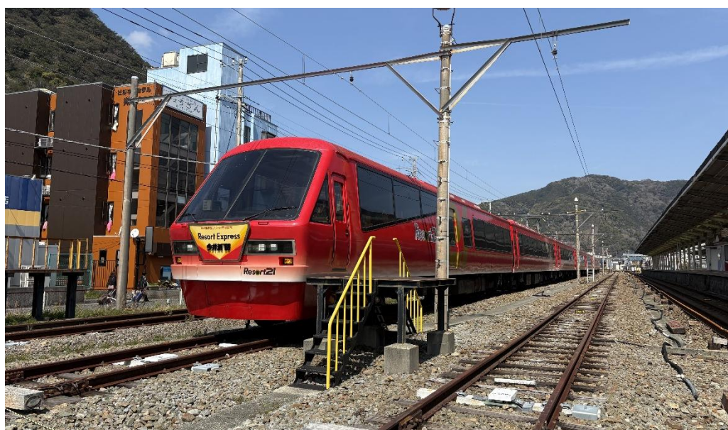
※伊豆急下田駅 5 番線イメージ（キンメ列車が停車している箇所）

伊豆急下田駅 5 番線発車 13：29 頃発 伊豆高原駅 3 番線到着 14：03 頃着