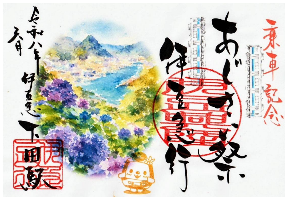
下田あじさい祭記念鉄印（直書き 1枚1,000円）