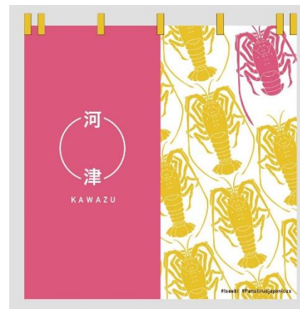
【「のれん」つきフォトブースのイメージ】