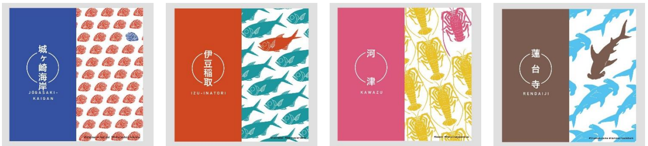
△設置されるフォトスポットのイメージ

伊豆急行線の「フォトジェニック駅」をめぐり、SNS映えする素敵な写真を撮影してみたいはいかがでしょうか？