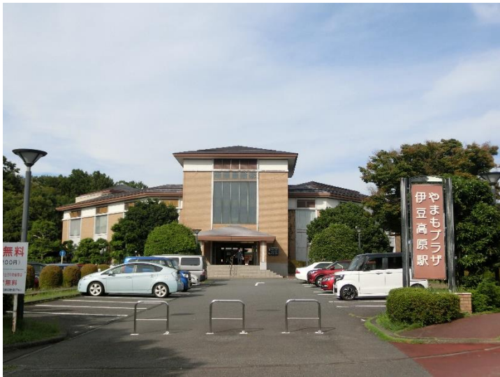
伊豆高原駅やまも口 外観