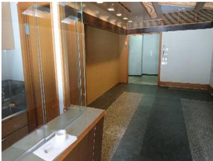
チャレンジショップスペース 内装