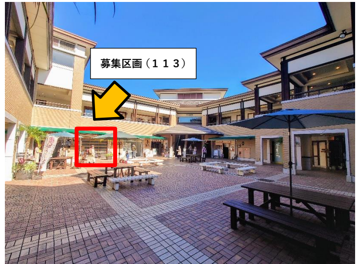
やまもプラザ パティオ(中庭)