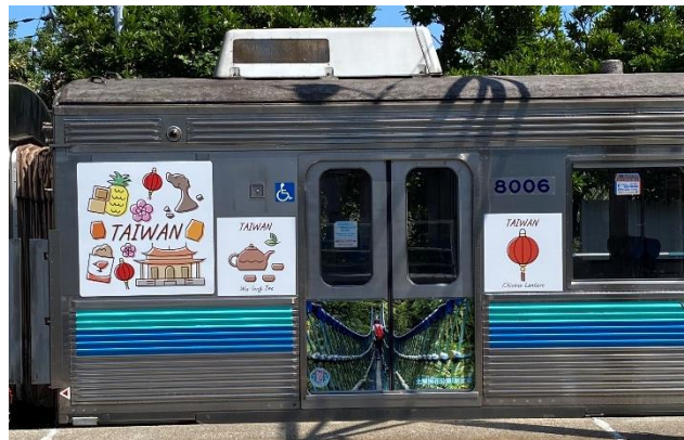
▲ラッピング電車イメージ

なお2024年5月13日(月)、伊豆急下田駅にて報道関係者向け取材会を実施いたします。運行時刻は運行日によって異なります(非公表)ので、ぜひこの機会に取材にお越しいただけますと幸いです。詳細は添付資料をご覧ください。