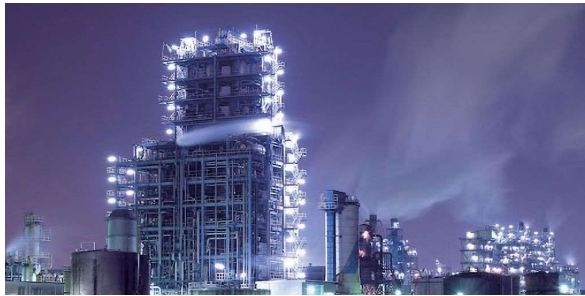
※画像はすべてイメージです

川崎工場夜景を代表する特徴的なプラント(別名ホワイトキャッスルとも言われる!?)が鑑賞できるスポットです。川崎工場夜景屋形船クルーズでは南渡田運河から間近でこのプラントが鑑賞できます。今回は、普段は入れない工場の敷地内をバスで回り同プラントを撮影できます。