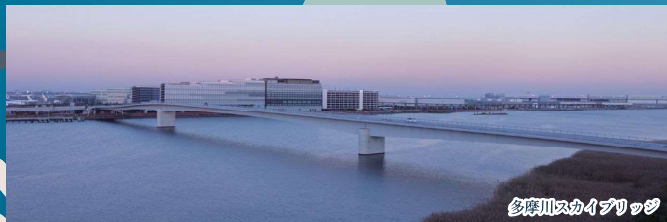
多摩川スカイブリッジ

※歩行や視聴覚などご不自由な方、身体障害者補助犬をお連れの方、その他特別な配慮を必要とする方はお申込みの際に必ずお申し出ください。