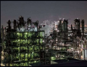
※画像はすべてイメージです

多数の光が集まる美しく幻想的な夜景を撮影できます。複雑な配管を取り巻く設備が、夜の風景に浮かび上がるその姿は圧巻です!