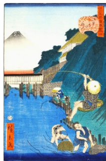
四 お茶の水の釣人