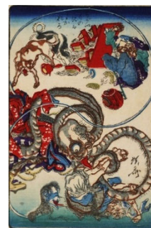
河鍋暁斎 狂斎百図 ながいものにはまかれろ

後期 戯画を得意とした幕末の浮世絵師・歌川 ひろかげ 広景の錦絵シリーズ「江戸名所道外 どうげづくし 尽」をご紹介します。