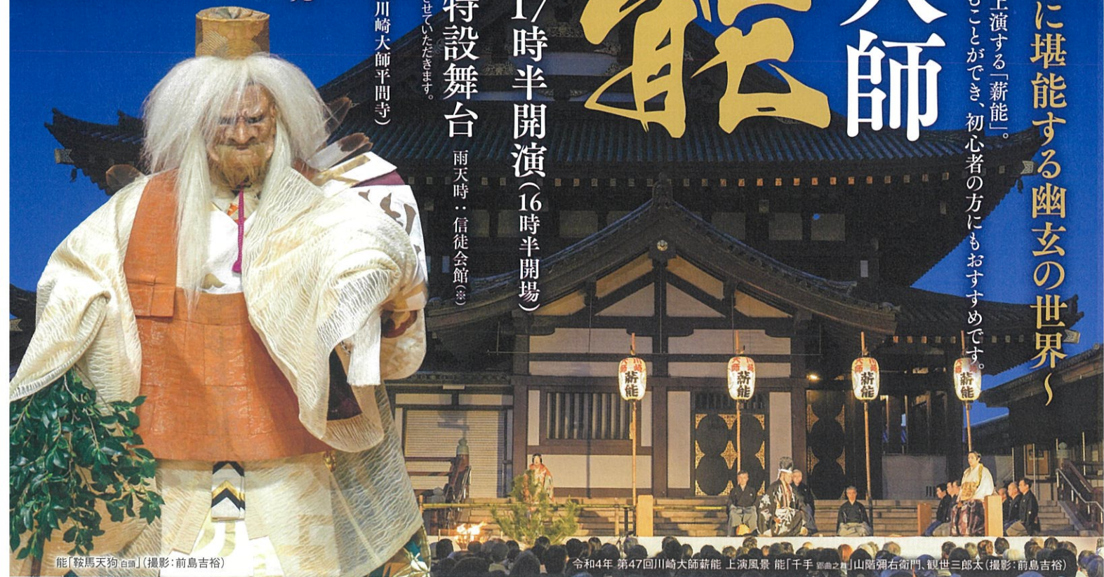
能「鞍馬天狗白頭」