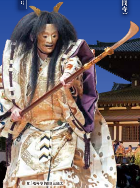
能「船弁慶」観世三郎太

開演前17時より演目解説があります。(解説：山階彌右衛門) 英語版プログラム配布あり