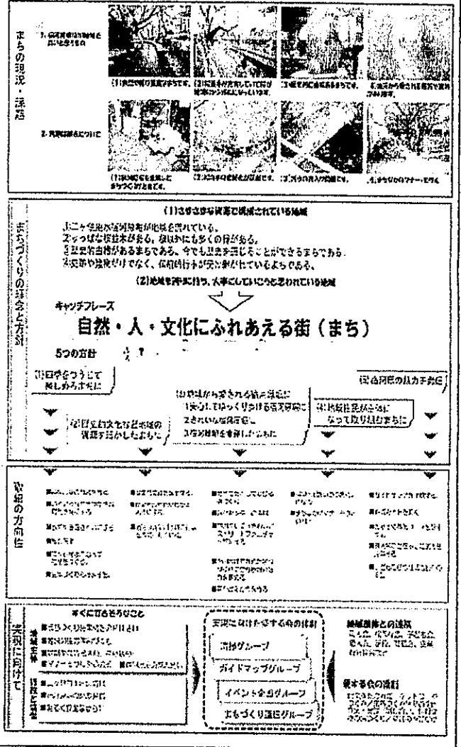
二ヶ領用水宿河原堀を中心としたまちづくり将来構想