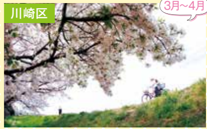
1 大師橋 さくら