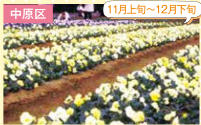
6 JAセレサ川崎中原支店 パンジー