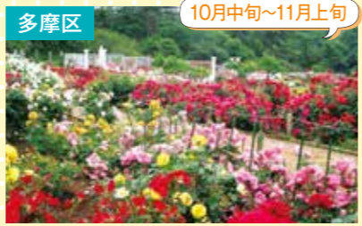
15 生田緑地ばら苑 ばら