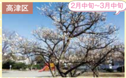
7 久地梅林公園 梅