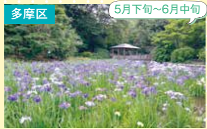
16 生田緑地 花菖蒲