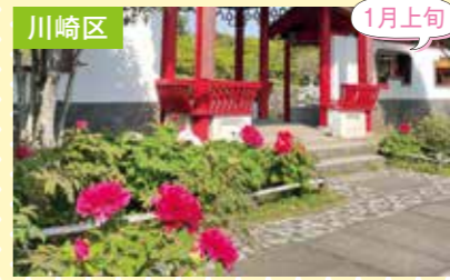
2 瀋秀園 ぼたん