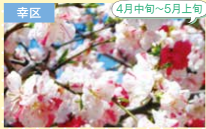
3 南河原公園 花桃