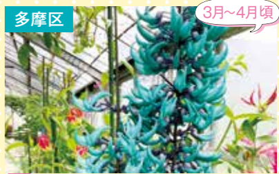
12 川崎市緑化センター ヒスイカズラ