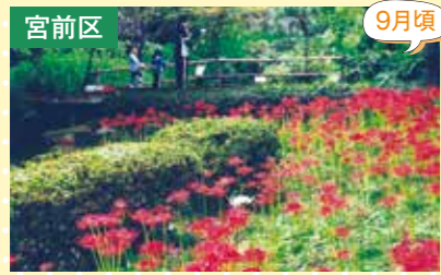
9 東高根森林公園 彼岸花