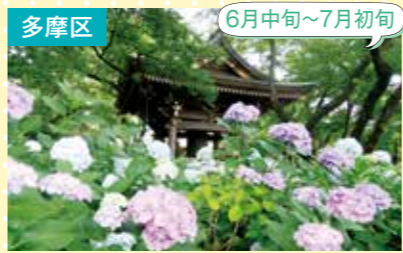
14 妙楽寺 紫陽花