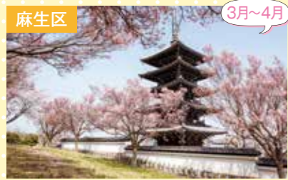
17 香林寺 さくら

川崎市には花の見所がたくさんあります。 横浜や品川、渋谷方面からのアクセスも良く、 また、羽田空港からも非常に行きやすい立地となっております。 自然豊かな公園、お散歩や観光に適した場所など おすすめの見所をご紹介します。