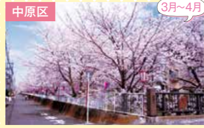
5 住吉ざくら さくら