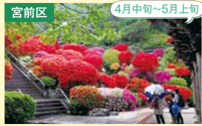
10 等覚院 つつじ