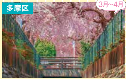
13 二ヶ領用水 さくら