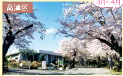
8 緑ヶ丘霊園 さくら