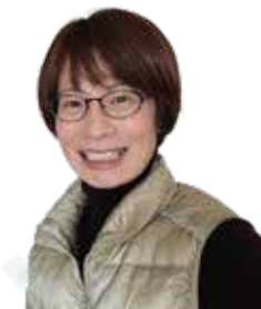
川崎工場夜景ナビゲーター

社会の教科書に載っていた京浜工業地帯にある石油化学コンビナートや化学工場等を舞台にした工場夜景の世界を巡り一緒にワクワクしましょう!