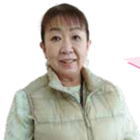
川崎工場夜景ナビゲーター

そんな川崎愛にあふれる「川崎工場夜景ナビゲーター」がご案内するツアーに、ぜひご参加ください。