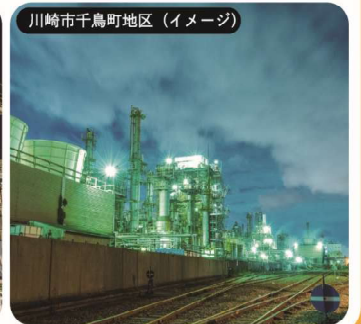
サンケミカル(イメージ)