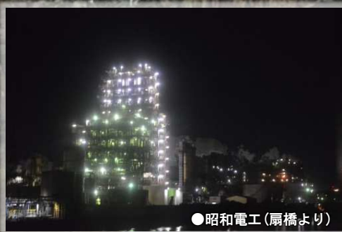
●昭和電工(扇橋より)