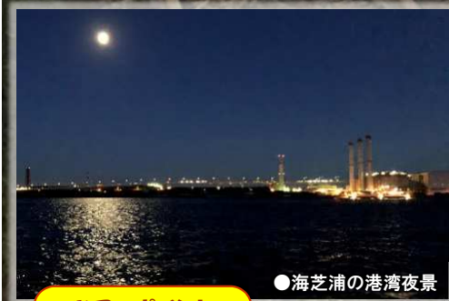
●海芝浦の港湾夜景