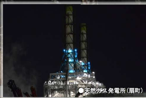
●天然ガス発電所(扇町)