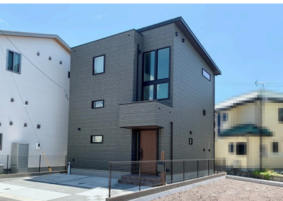
迫力のある4連窓がスタイリッシュな外観