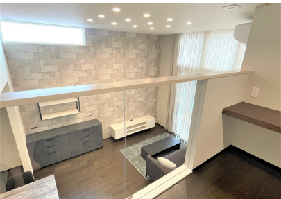
程よい距離感で空間がつながる1.5階