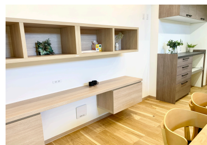
ご家族みんなが使えるワークスペース