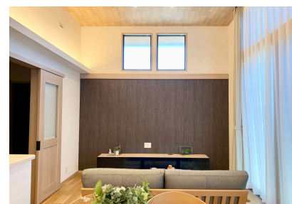
天井までのハイサツツで明るいリビング