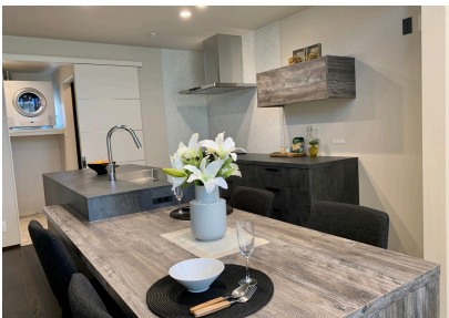
高級感のあるキッチンハウスの「デュエ」