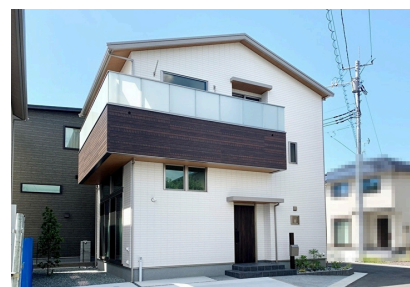
家を約半周するほどのビッグバルコニー