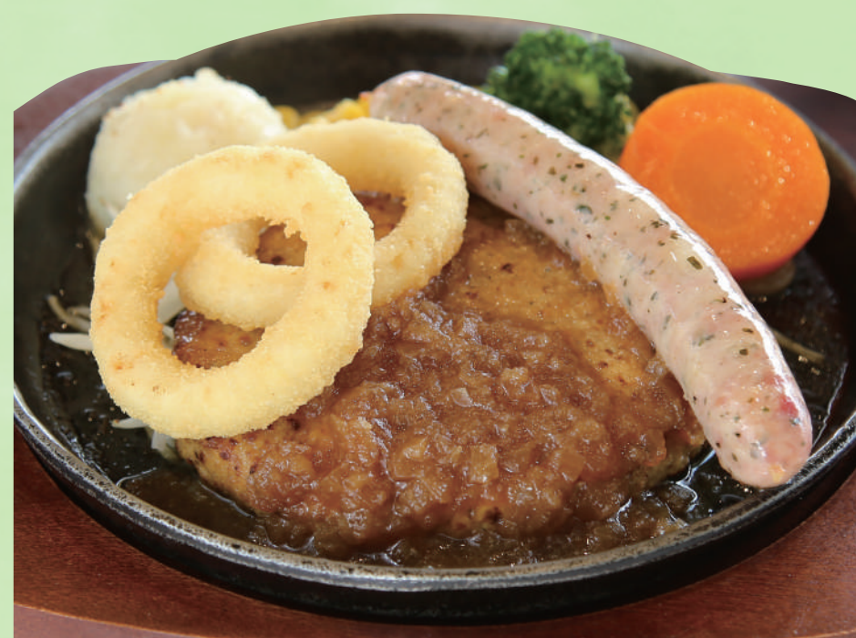
ラム肉70%・豚肉30%を独自調味料の配合で 手作りの、マザー牧場自慢の一品! 自家製手ごねラムハンバーグ