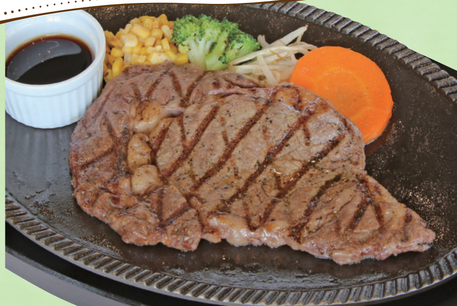
柔らかく旨味のある牛リブロースを グリルでこんがり焼き上げました 牛リブステーキ (200g)