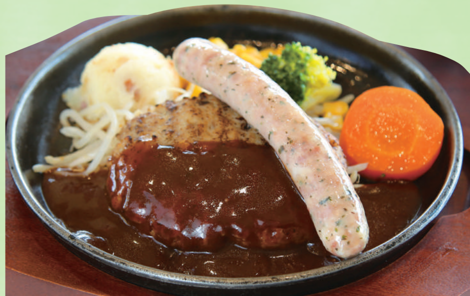
ハンバーグを特製デミグラスソースで! マザー牧場オリジナルハンバーグ(140g) & 自家製ソーセージ