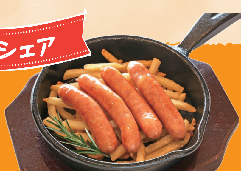
あらびきミニソーセージと ポテトのセットです 自家製ソーセージ&ポテトデュオ