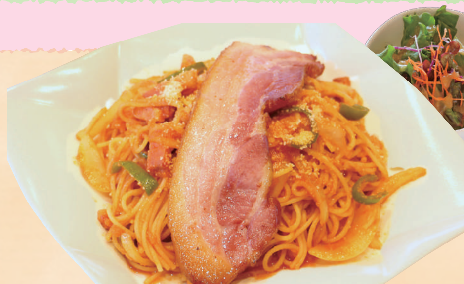
マザー牧場で40年前に提供していた伝統の味を 再現。隠し味にマザー牧場牛乳使用!