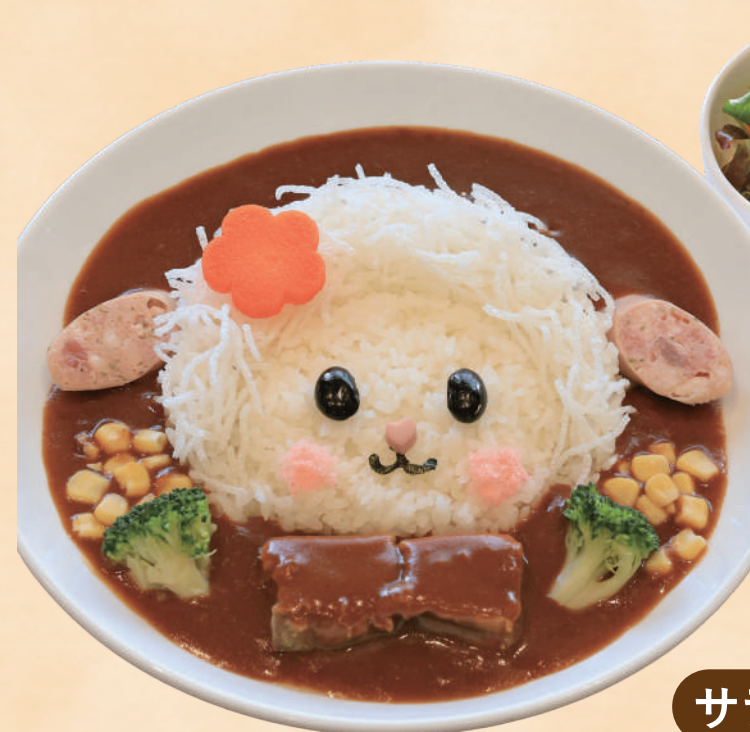
合し合えない マザー牧場の赤ちゃん羊を モチーフにしました お子様味も選べます!