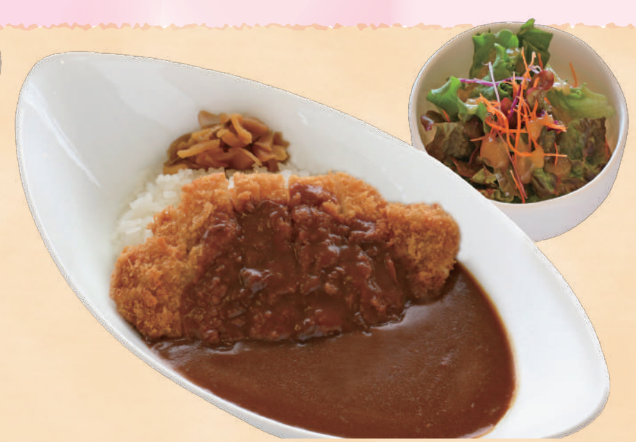
サクサクでジューシーなロースかつに マザー牧場特製カレーをかけた自信作 カツカレー