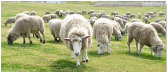
のんびり草を食む羊たち。 臆病な性格だから驚かさないように そっと近づこう。