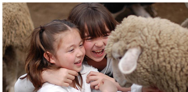
思わずビックリするぐらい 大接近できちゃうかも!?