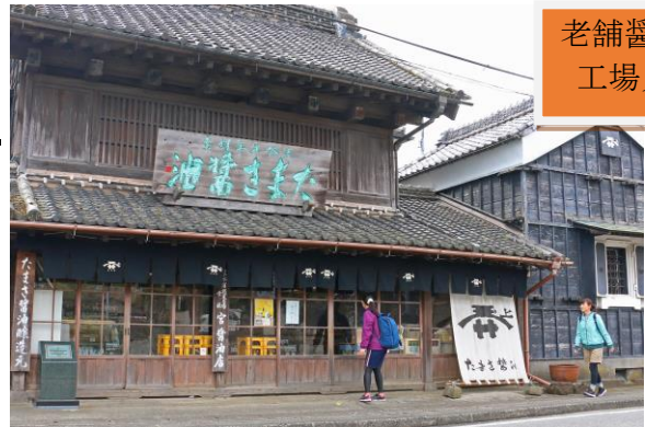
老舗醤油店 工場見学

コース途中には人気のアルパカがお出迎え(10:30~12:00まで)！さらに、ゴールでは牧場自慢の牛乳サービス！参加者はマザー牧場の入場料が 500円 になる特典もあります！