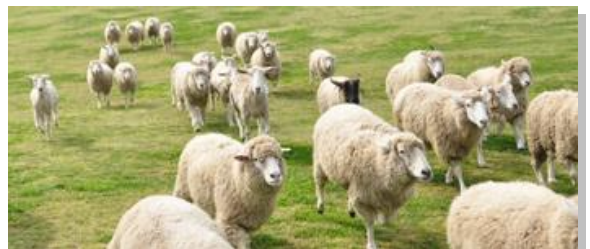
羊が気づいてくれると・・・ (群れる習性があるので1頭が動くと 周りの羊たちがついてくることも！)