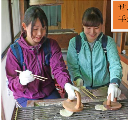
せんべい 手焼き体験

菜の花や梅、生まれたばかりの赤ちゃん羊たちが待つ春爛漫のマザー牧場まで歩こう！ コース途中の城下町には「佐貫城跡」にある見晴らしの良い展望台や、湧き水のある「宝龍寺」など見所も数多くあり、歴史にふれながら楽しめます。なかでも店頭の大きな桶が目を引く老舗醤油店では、今回特別に工場見学ができます。また、食べ応えのある大きな肉団子や炭火手焼きせんべいが味わえるお店も立ち寄れます。