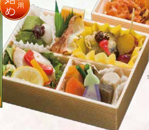
18.0 × 13.2 cm の2段