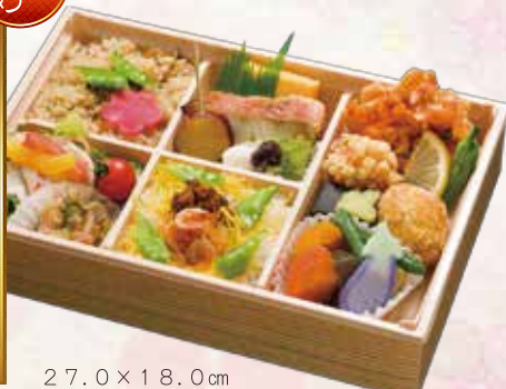
27.0 × 18.0 cm