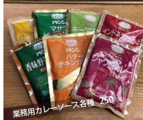
業務用カレーソース各種 250