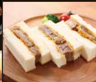
牛タンカツサンド 780