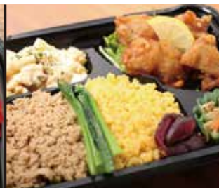
若鶏の唐揚げ弁当 980