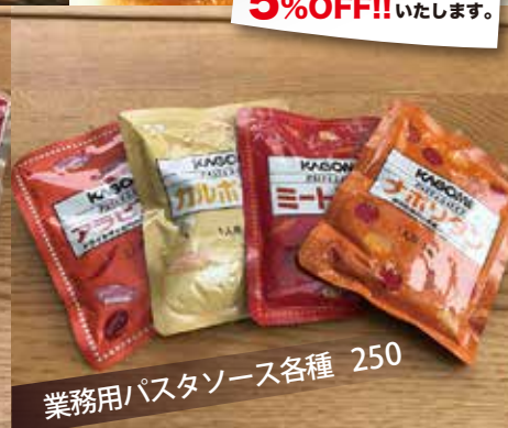
業務用パスタソース各種 250