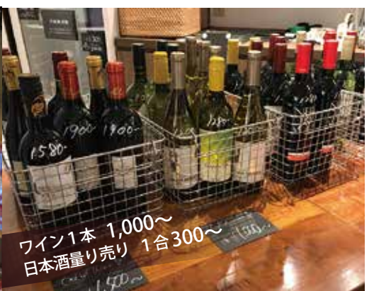
ワイン1本 1,000~ 日本酒量り売り 1合 300~