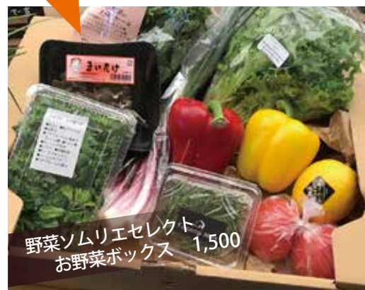
野菜ソムリエセレクト お野菜ボックス 1,500

地元農家さんから届く新鮮野菜、業務用・プロ品質の冷凍食品、 期限切れ間近の加工食品などお値打ち価格でご用意しています。