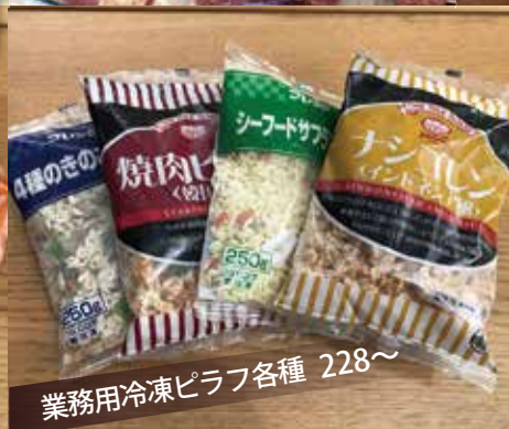
業務用冷凍ピラフ各種 228~