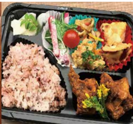
十六穀米とお惣菜のお弁当 850