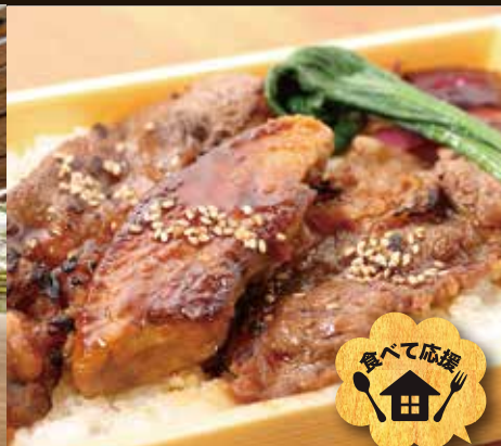
フォアグラ牛カルビ重 980

ご購入頂いたお弁当やお惣菜を開放感溢れる ガーデンテラスでお召し上がりいただけます!