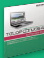
TELOP CANVAS 4 for Premiere Pro