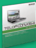
TELOP CANVAS 4 for EDIUS