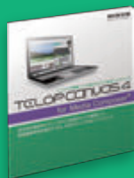
TELOP CANVAS 4 for Media Composer®