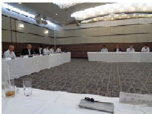
(中部地方整備局営繕部)