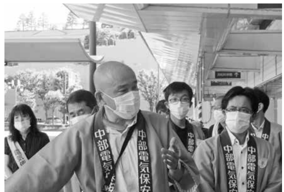
配布エリアの説明をする松下スタッフ副部長