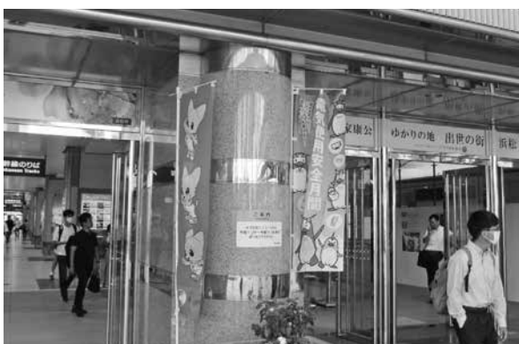
掲示した安全月間ののぼり旗