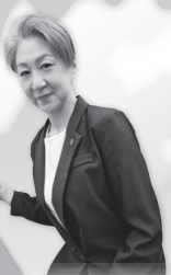
京都府工組女性部

登録されていない方は、まず登録を! 登録いただきますと受講期限3か月前までに講習をお知らせいたします。