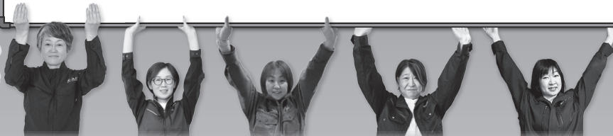
広島県工組女性部