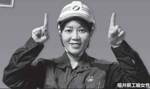
福井県工組女性部