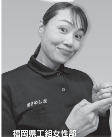
福岡県工組女性部