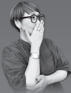
高知県工組女性部