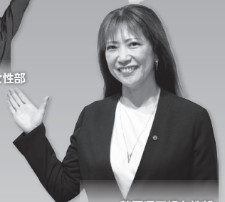
静岡県工組女性部