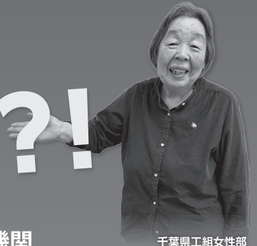
千葉県工組女性部