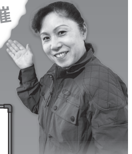
沖縄県工組女性部