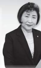
茨城県工組女性部