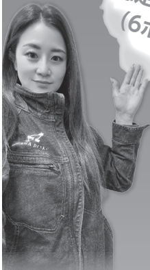
岡山県工組女性部