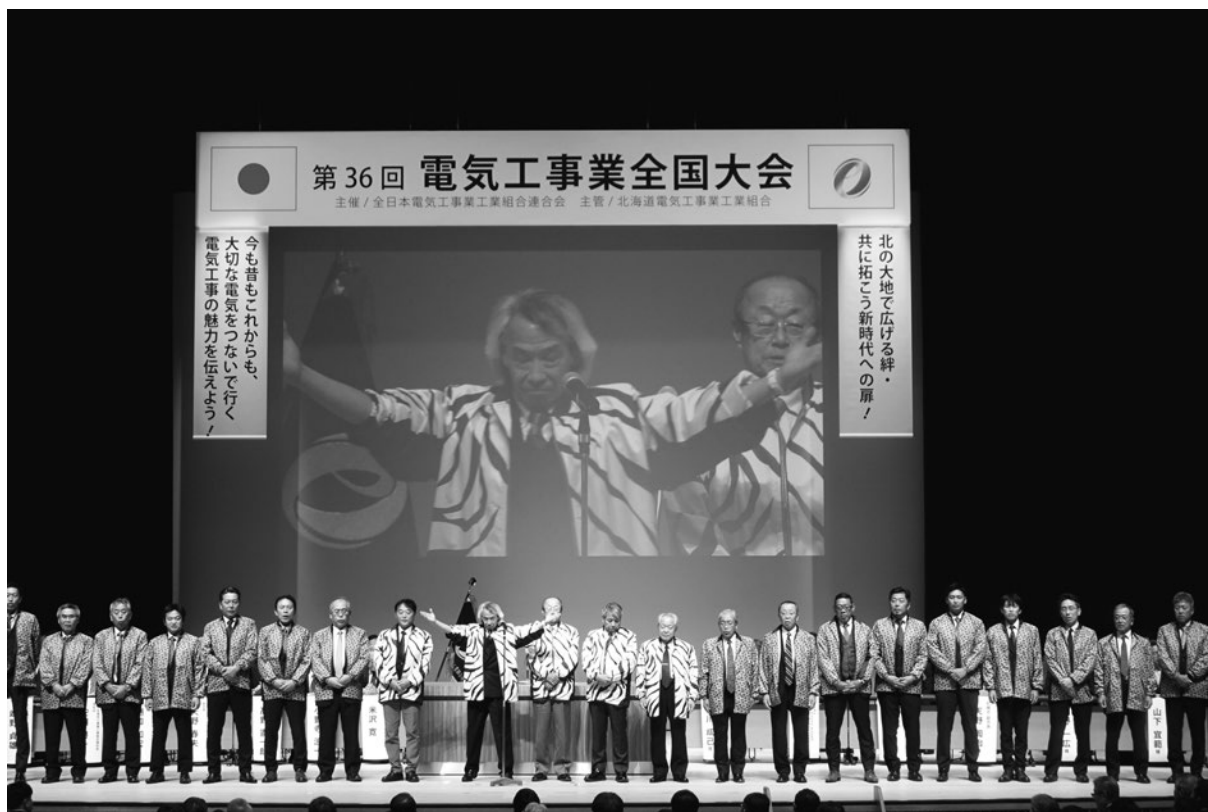
第36回電気工事業全国大会（札幌）における次期開催県のPR