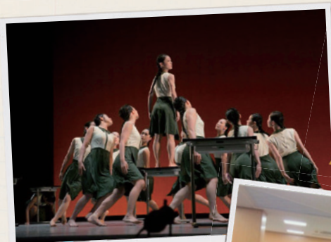
作品 机上の空論 (フォスタジオ八木)

— 同じ学び舎で過ごされた皆さんが其々の道を豊かに歩んでいけることだろうと思えることが私の過去への誇りです。