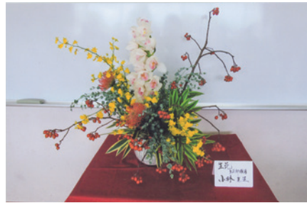
作品 展示物 募集中です