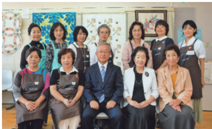
今年より学園祭のお手伝いは、卒業回の末尾が西暦末尾と同じ方をお願いしております。今年は5のつく回生です。