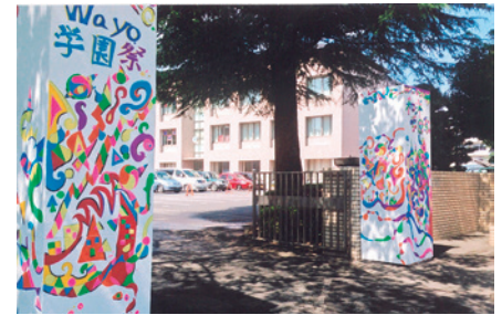
ミニバザーも提供品のご協力をよろしくお願いします