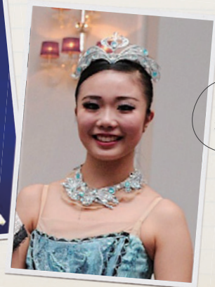
中学まで 和洋で学び留学