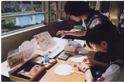
消しゴムはんこでうちわ作り体験コーナー