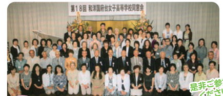
次回 同窓会19回総会開催(平成28年6月予定)