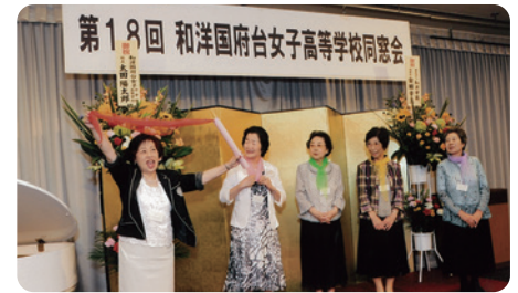
受け継がれていく同窓会・5代の歴代会長のもと和洋は一つの家族です。(H26年6月総会にて)

皆様のご健勝をお祈りしつつ、「青春時代の心のふるさと和洋」同窓会活動に更なるご支援を賜りますよう切にお願ひ申し上げましてご挨拶といたします。