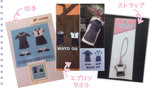
同窓会応援オリジナルグッズ販売してます