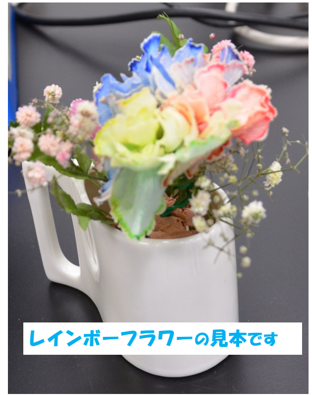
レインボーフラワーの見本です